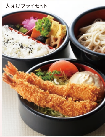
大えびフライセット