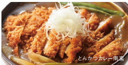
とんかつカレー南ばん